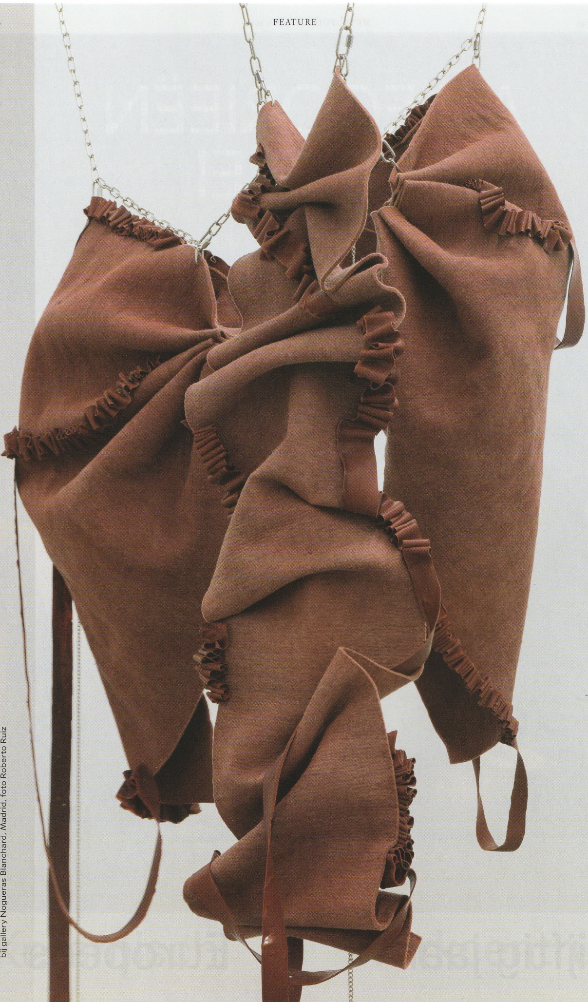
Mercedes Azpillicueta, werk uit de serie The Old Dream of Symmetry , 2019, bij gallery Noguerras Blanchard, Madrid