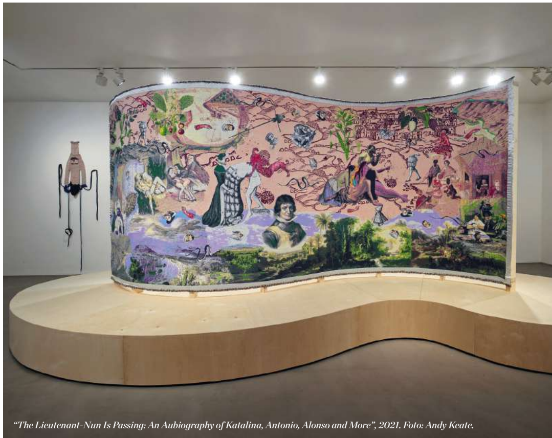
"The Lieutenant-Nun Is Passing: An Aubiography of Katalina, Antonio, Alonso and More", 2021.

Esta artista argentina, afincada en Ámsterdam, se crió entre las sedas y las telas de la boutique de su madre. Parte de su obra multidisciplinar se centra en personajes históricos situados en los márgenes -feministas, queers , migrantes, exiliados...- Su reciente obra, The Lieutenant Nun , que irá a ARCOmadrid 2022 con Nogueras-Blanchard, se exhibió recientemente en esta galería y en Gasworks (Londres); es un tapiz jacquard de 4 m de largo que se inspira en la azarosa vida de la monja alférez, Catalina de Erauso, una figura del s. XVII. noguerasblanchard.com