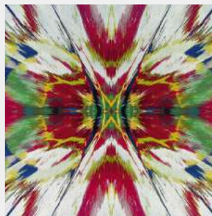
"Enter the Infinite-Revelation", 2016.

(Del 12 de marzo al 19 de junio). Textiles de artistas , en la Fundación Barrié de A Coruña, exhibe tejidos realizados por grandes artistas de los s. XX y XXI: Picasso, Dalí, Léger, Miró, Calder, Hodgkin, Damien Hirst (aquí, su tapiz en tela jacquard) y muchos más. Es organizada por el Fashion and Textile Museum de Londres. fundacionbarrie.org