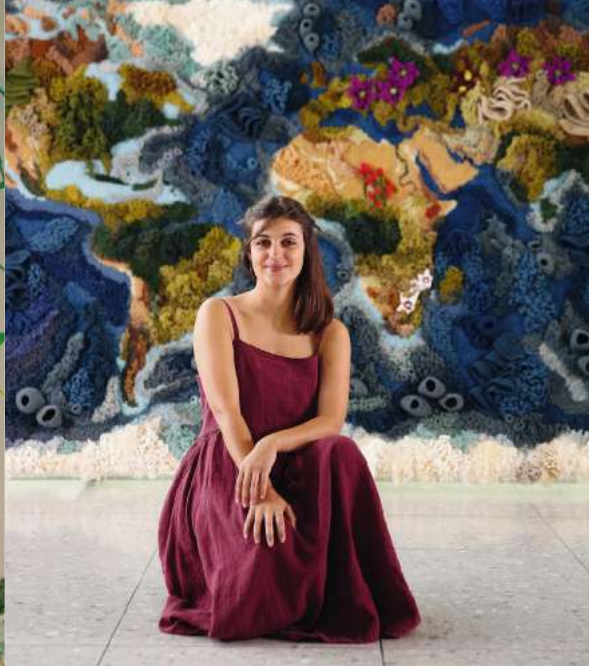
Tapiz "Botanical", 2019.