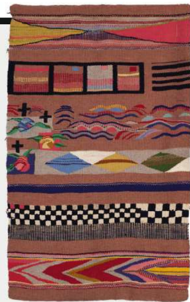
"Nuria", 1994.

(Del 22 al 30 de octubre). La International Textile Art Biennial 2022 es en Haacht, Bélgica. artkspg.be