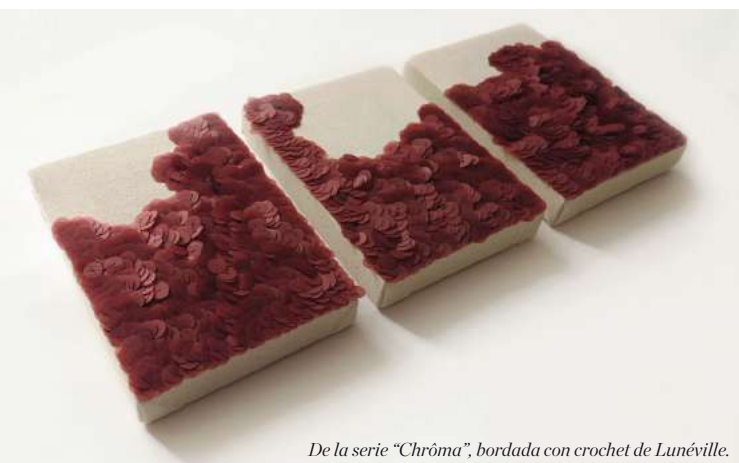
De la serie "Chrôma", bordada con crochet de Lunéville.