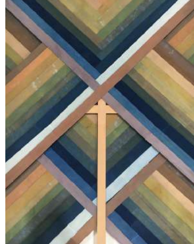
"Juni Hitoe I".