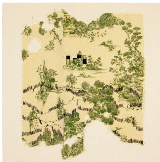
"La Silla de la Reina", 2019.

"El mundo textil recorre muchos de mis proyectos, tanto material como conceptualmente", señala la artista. maribelbinimelis.com